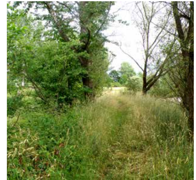
Lebensraum strukturreicher Waldrand

In Sachsen finden wir sie hauptsächlich im Elbtal. Ihre Lebensräume sind vielfältig: Laubholzgebüsche, Säume, Trockenwälder, Trocken- und Halbtrockenrasen.