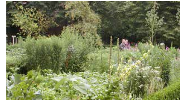
Lebensraum traditioneller Bauerngarten

Die Vorkommen des Echten Herzgespanns reichen von Europa bis zum Himalaja. Wir finden es bei uns im Elbtal sowie in Sachsens Osten, Norden und Südwesten. In den Vorgebirgs- und Gebirgslagen kommt es kaum vor. Es bevorzugt locker-humose, lehmig-tonige und stickstoffreiche Böden an Straßen-, Weg- und Waldrändern sowie auf Ruderalstellen im ländlichen Raum.