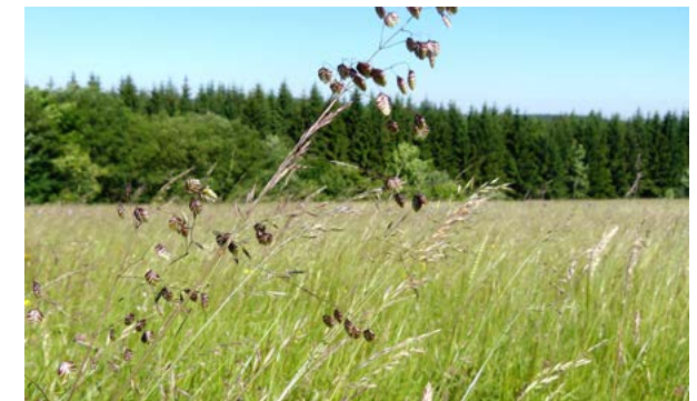
Das Zittergras in seinem natürlichen Lebensraum

Das Gewöhnliche Zittergras hat seinen Ursprung im gesamten europäischen Raum sowie der Türkei und dem Kaukasus. Es wächst überall in Sachsen bis in die höheren Lagen der Mittelgebirge. Seine Lebensräume sind magere, nährstoffarme Wiesen und Weiden, Borstgras-Magerrasen und Halbtrockenrasen sowie auch nährstoffarme Moore und Feuchtwiesen.